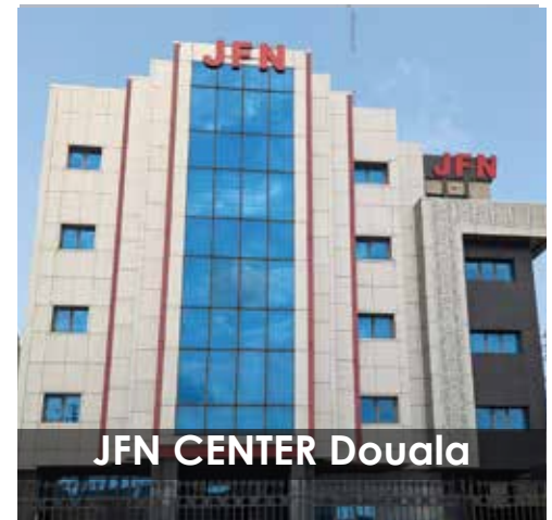
JFN CENTER Douala

Dans le souci de transmettre aux africains des connaissances et des compétences nécessaires dans une société immergée dans le numérique, JFN CENTER héberge également en son sein un centre de formation professionnelle et continue aux Technologies et aux Métiers du futur , au Management Stratégique ainsi qu'au Leadership Transformationnel .