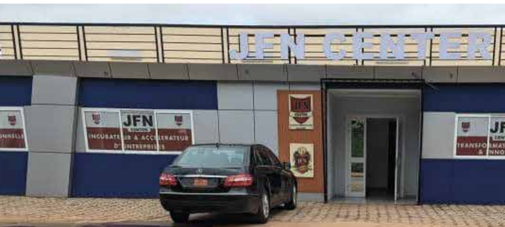
JFN CENTER Yaoundé