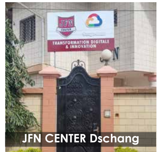
JFN CENTER Dschang